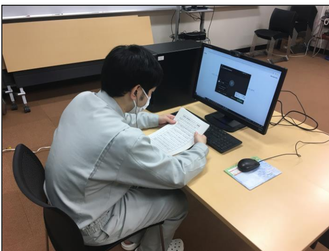
図 1 研修の様子

3 日間の研修でしたが得られるものは非常に多かったです。今回が初めてのオンライン研修でしたが、オンライン研修に慣れるよい機会であったと思います。講義して下さった先生方や参加者の皆さんに感謝申し上げます。