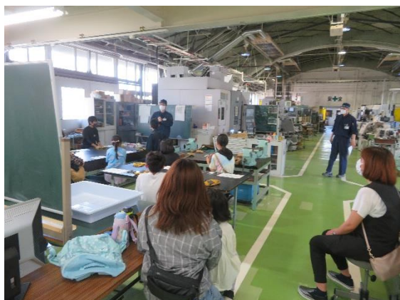
図3 講師による説明の様子